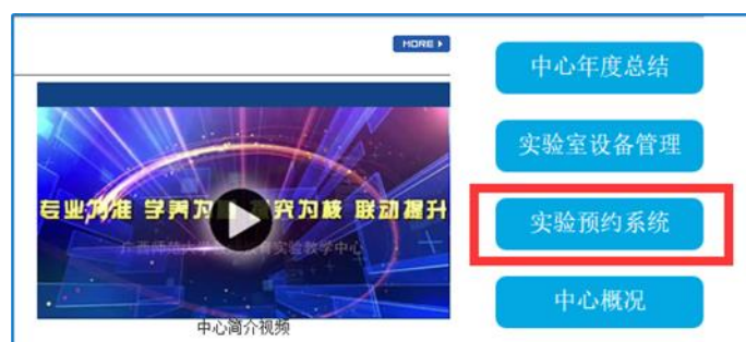
实验中心网站右侧栏目