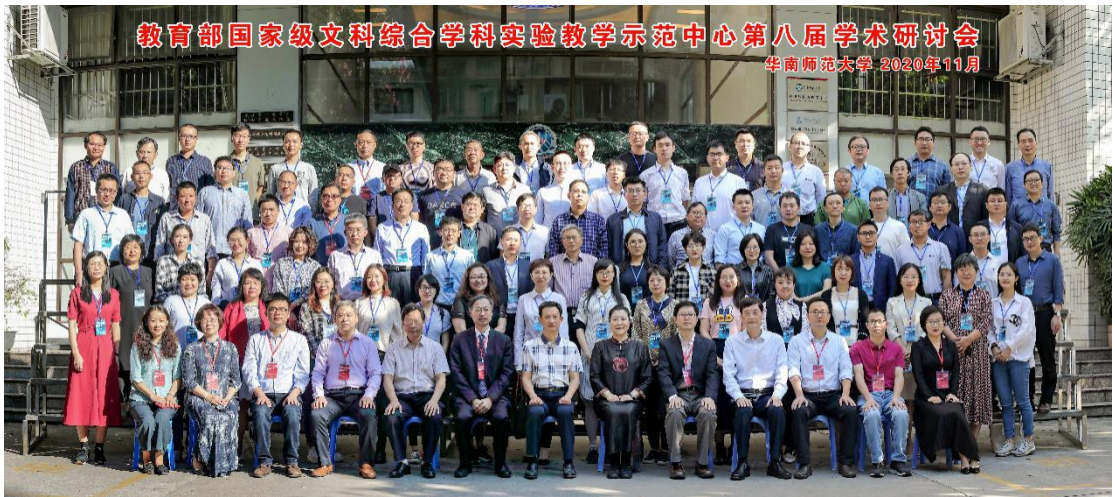
图二 参加国家级文科综合学科实验教学示范中心第八届学术研讨会

实验教学示范中心第八届学术研讨会。这些学术会议的召开、学术讲座的开设和派出教师参加各类学术活动，不仅开阔了师生的学术视野，也引起了广西和国内外学术界的广泛关注，有力提升了学中心的学术影响力。