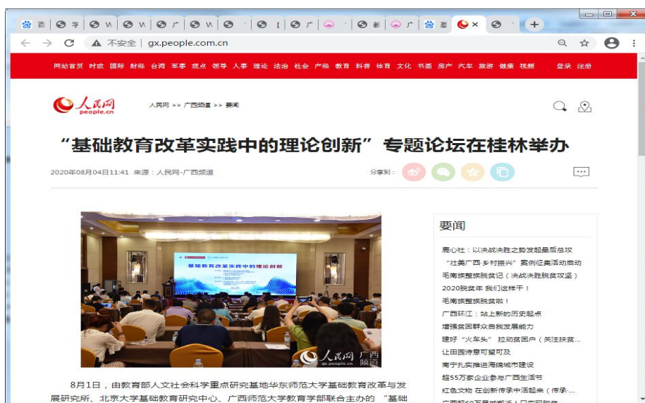
图四 “基础教育改革实践中的理论创新” 专题论坛

http://gx.people.com.cn/n2/2020/0804/c390645-34204438.html