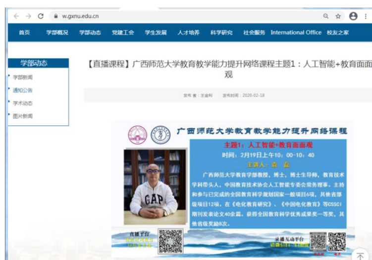
图一 广西师范大学教育能力提升网络直播课

教学能力提升网络课程直播活动,校内专家为全校教师做线上教学指导讲座 10 个,疫情防控最艰难时期心理学系的老师们利用实验中心智能平台为中小學生及家長提供了心理輔導服務,点击量突破 100 万。并鼓励和支持中心教师充分利用网络信息资源开展线上教学,线上线下混合式教学以及线上教学的课题研究,为 87 门专业课程制作了线上学习资源。